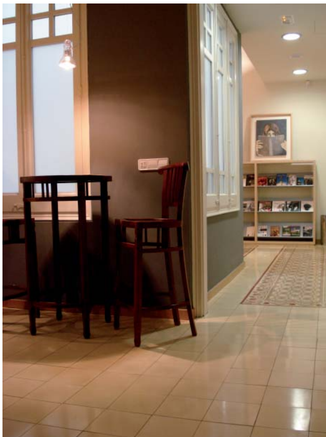
vista del passadís que connecta la zona d'esmorzars amb la sala d'estar