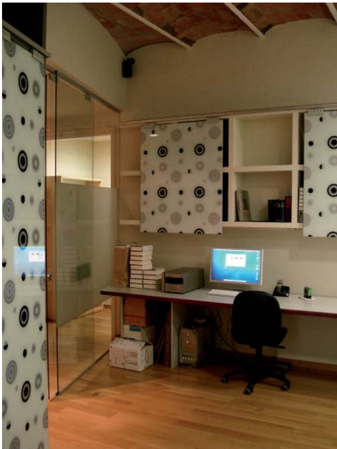
Zona de taules de treball del departament de disseny gràfic