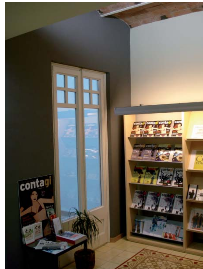
zona d'espera i vista del pati interior